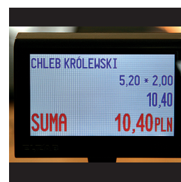
Kolorowy wyświetlacz TFT