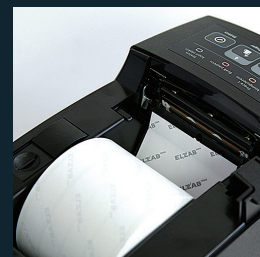
Mechanizm drukujący easy load